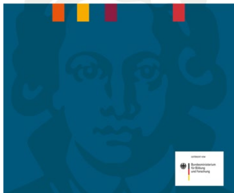
Ein starker Start

Am 6. Juli fand an der Goethe-Universität Frankfurt im Rahmen des Qualitätspaktes Lehre die Tagung „Starker Start ins Studium“ statt, an der über 100 Personen teilnahmen. Die Universität stellte ihr eigenes QPL-Projekt vor, das mit vier fachbereichsübergreifenden Zentren in den