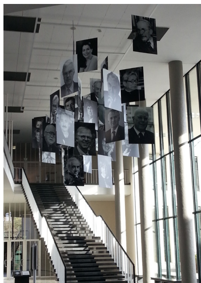
Ort der ersten Begegnung: Henry-Ford-Bau der Freien Universität Berlin