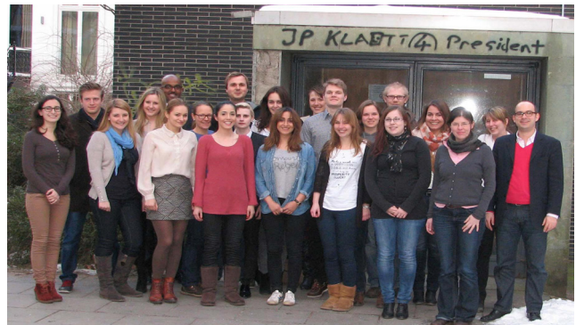
Das Lehr-Team aus 14 studentischen Co-Tutoren und 14 AG-Leitern sowie Prof. Klatt

Trotz vieler Einzelmaßnahmen war es schwer, gegen die Prüfungsfokussierung der Studierenden anzukom-