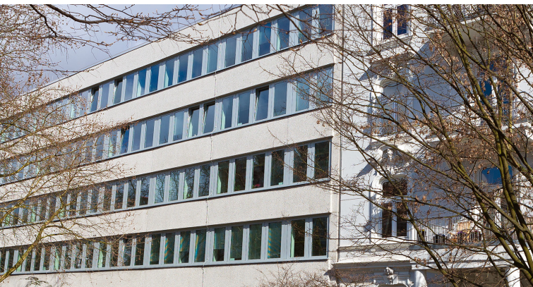
Das Regionale Rechenzentrum in der Schlüterstraße