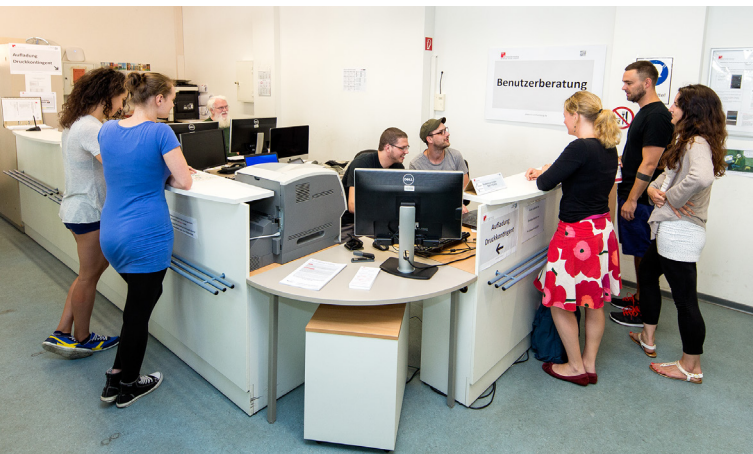
Persönliche Beratung in Raum 14b des RRZ

Die Nutzerinnen und Nutzer erhalten dort z.B. schnelle Hilfestellung bei der Arbeit in den Windows-, Mac- und Linux-Pools, bei Problemen mit Druckern und Scannern oder bei der Einrichtung des WLAN-Zugangs auf dem eigenen Notebook.